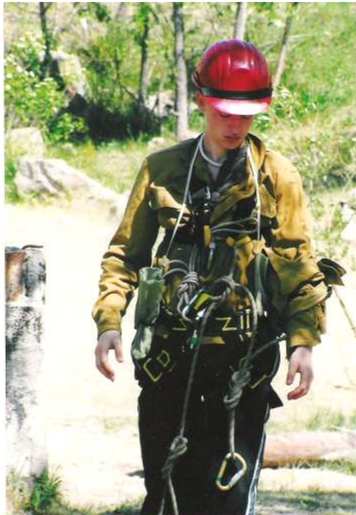
Фото вихованців гуртків туристко-краєзнавчого напрямку