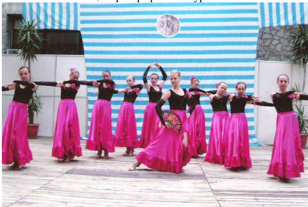
Вихованці хореографічного гуртка «Лілея»