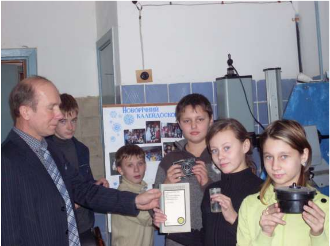
Фото вихованців гуртків науково-технічного напрямку