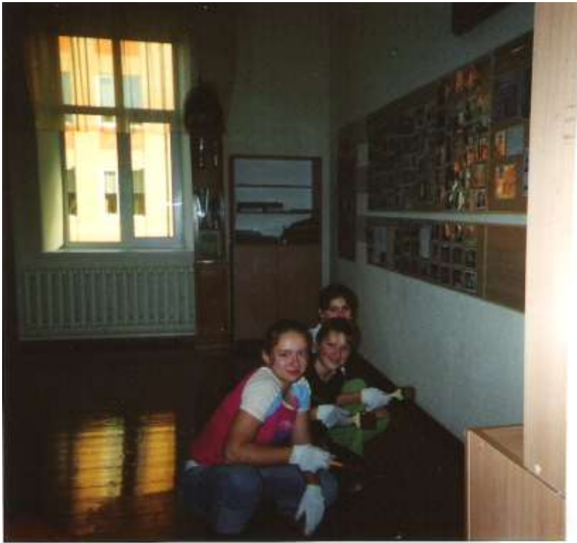
Тігронівка до відкриття