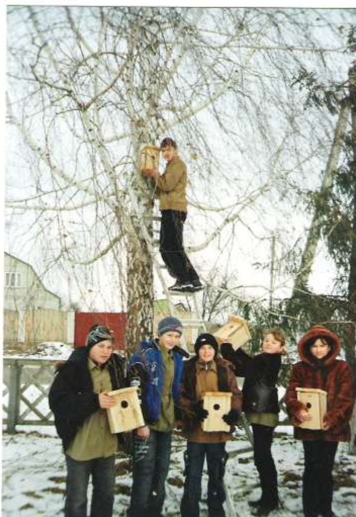
Вихованці Дорогинського учнівського лісництва під час проведення різних природоохоронних акцій