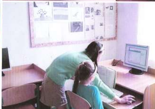
Під час занять гуртка «Комп'ютерна абетка»