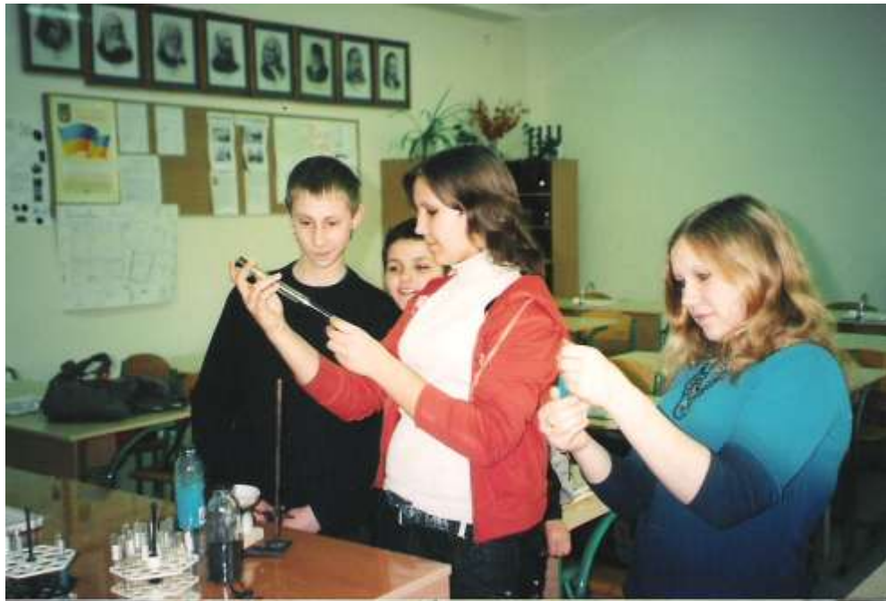
Фото вихованців гуртка «Основи наукової діяльності. Хімія»