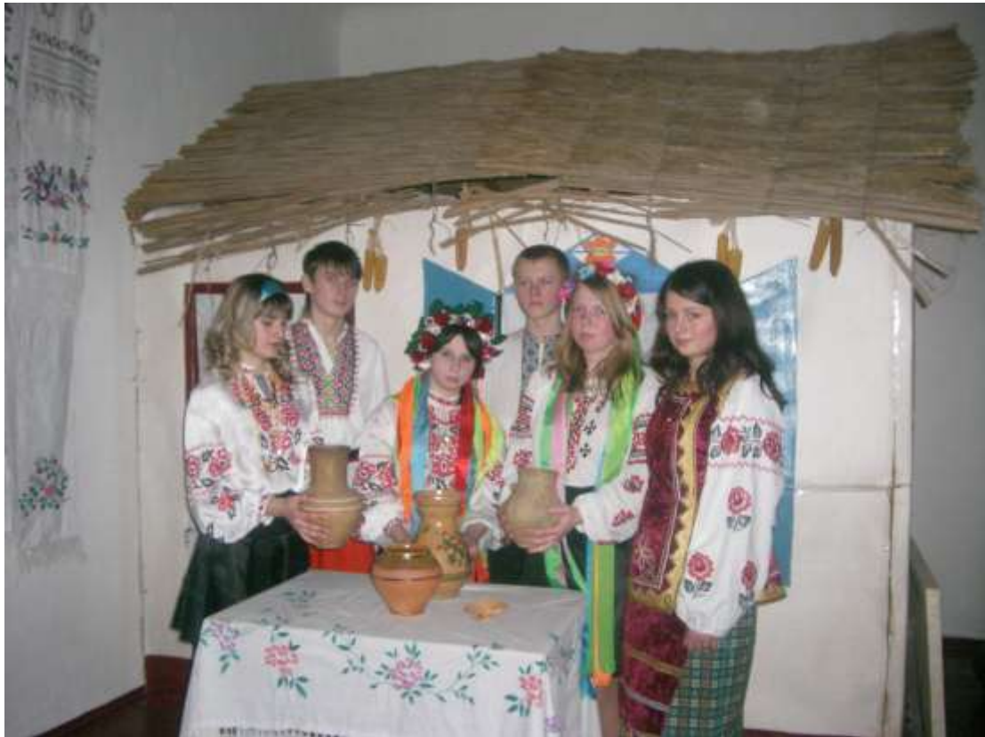
«Українські вечорниці» вихованці театрально-драматичного гуртка ФРЕЕЦ при Малополовецькій ЗОШ І-ІІІ ст..