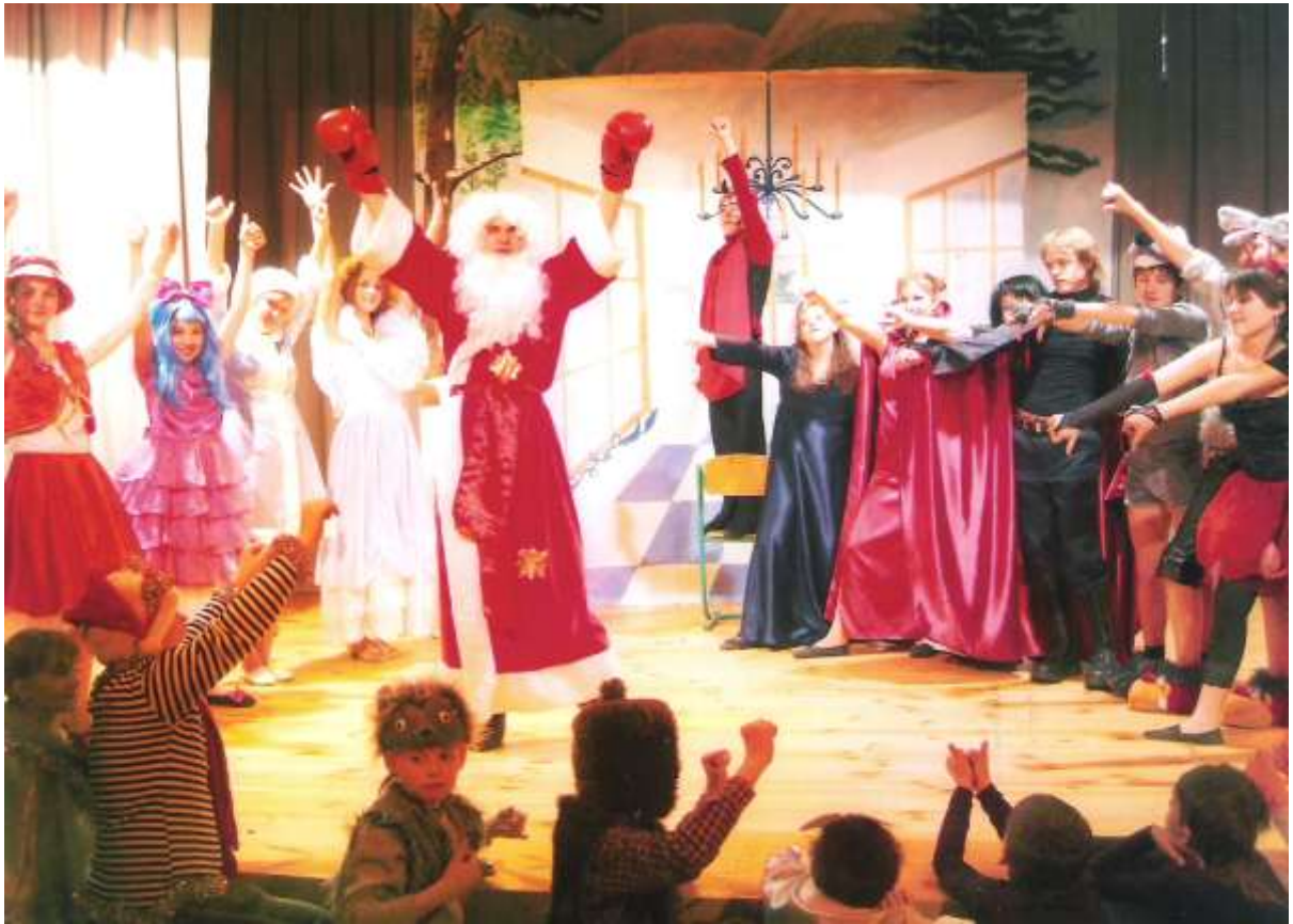
Театрально-драматичний гурток ФРЕЕЦ при Борівській ЗОШ І-ІІІ ст.