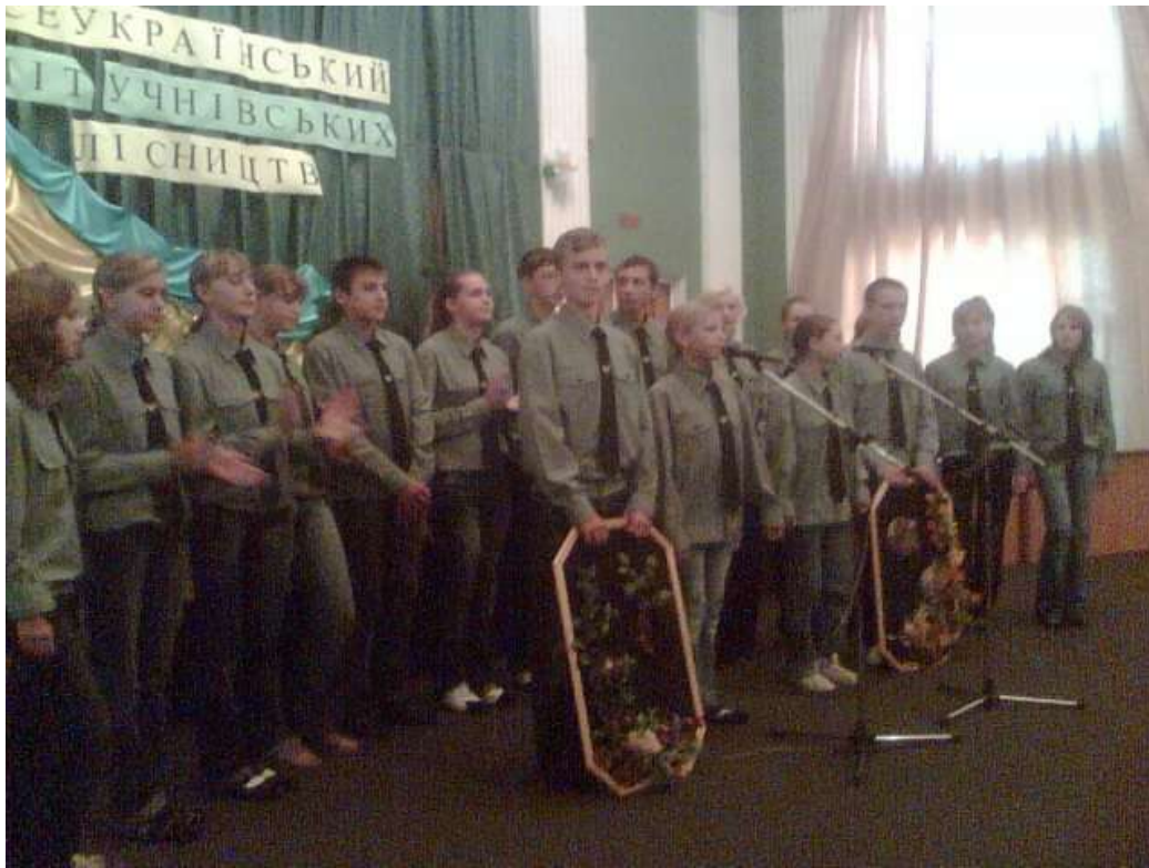
Вихованці Дорогинського, Веприцького та Дмитрівського учнівських лісництв на Всеукраїнському зльоті учнівських лісництв (вересень 2008 року)