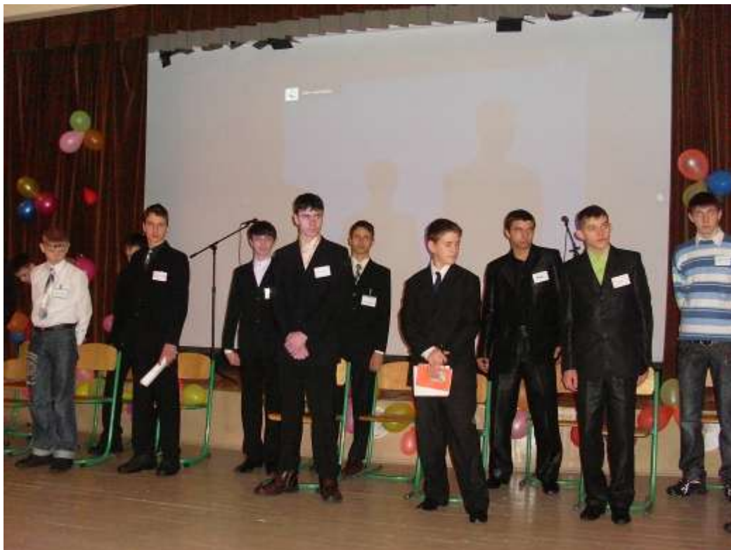
Фото вихованців гуртків художньо-естетичного напрямку