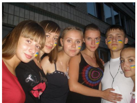
У колі лідерів