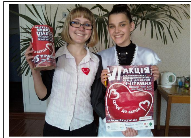
Волонтери Фастівської ЗОШ І-ІІІ ст.

Висловлюємо щирі подяку всім учасникам акції! Тільки спільними зусиллями ми можемо змінити світ на краще!